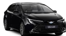
209 Черно *