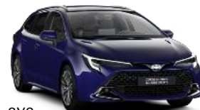
8Y8 Синя хвойна *