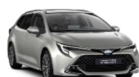
1J6 Платина §