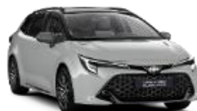
1K6 Динамично сиво*