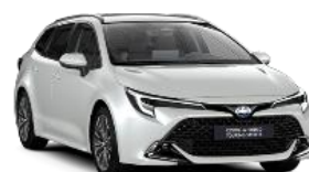
089 Бяла перла §