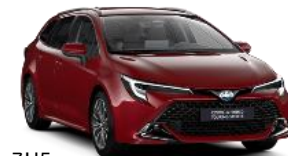
3U5 Огнено червено §