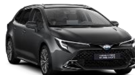
1G3 Пепеляво сив *